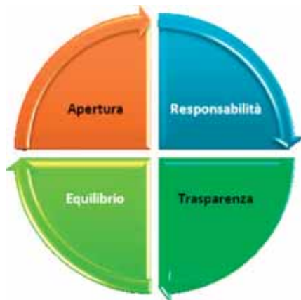
A REGOLA D'ARTE: COME LAVORA RENA

Per guidare la propria azione RENA si è data dei principi operativi precisi. Dentro l'associazione ogni ruolo è svolto a tempo determinato e la responsabilità della gestione e dello sviluppo delle attività e delle iniziative è diffusa e condivisa. Ogni arenauta risponde a titolo individuale degli atti e delle posizioni assunte all'interno e all'esterno dell'associazione e si fa portavoce nei propri contesti di riferimento dei valori e degli obiettivi di