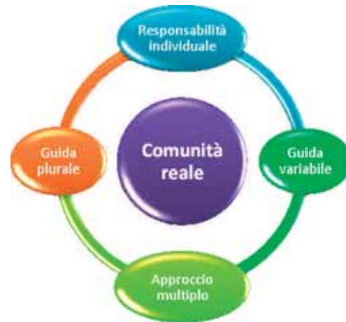
COME SI STA DENTRO RENA

Per mantenere un alto profilo etico gli arenauti hanno deciso di aderire a quattro valori fondamentali: Apertura, sul mondo, alle idee, nei confronti delle persone; Responsabilità, nei confronti di sé e degli altri; Trasparenza, nelle parole e nelle azioni; Equilibrio, nella formulazione di un'idea, nella realizzazione di un progetto, nella costruzione di un'identità. Questi valori non solo informano la loro condotta, ma rappresentano anche