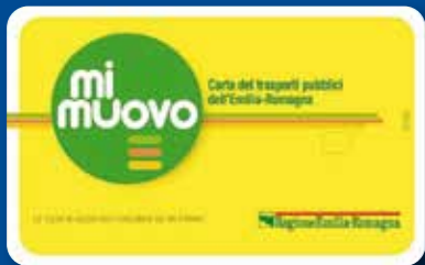
MI MUOVO CARD Abbonamenti mensili e annuali