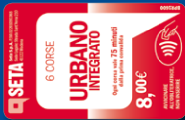
Biglietto multiplo orario 6 corse valido 75 minuti dalla convalida

In caso di neve, per il trasporto pubblico informazioni al numero SETA